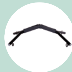
Barra aggancio imbragatura a 4 punti