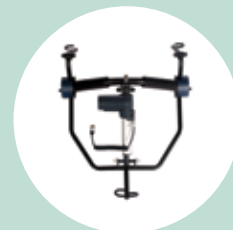
Sistema a culla elettrico

Vi invitiamo a visitare il nostro sito internet www.miltecho.com dove troverete ulteriori informazioni e specifiche riguardanti i nostri prodotti.