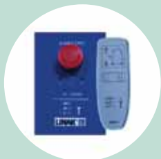
Centralina e telecomando evoluti