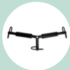
Barra aggancio imbragatura a 3 punti